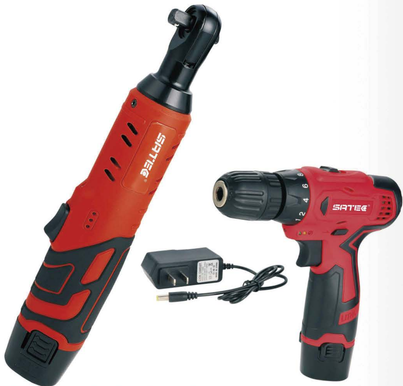
锂电棘轮扳手 Li-ion Cordless Ratchet Wrench