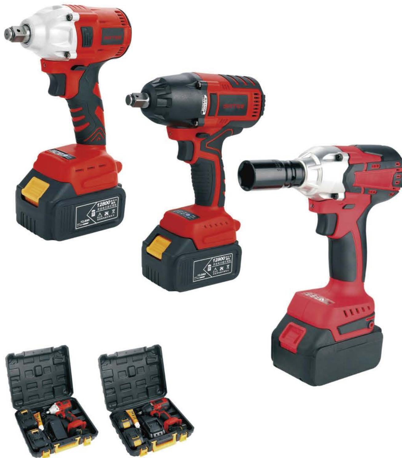
锂电扳手 Li-ion Electric Wrench