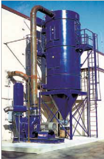
配备脉冲型分离器的 Power Mizer 真空机，为印刷电路板制造商提供了一种可持续运转的高速集尘系统。

除直销办事处外，史宾沙还设有遍布整个北美的制造商代表处，并在全球设有多家代理处。总之，史宾沙拥有业内最庞大的销售组织，可现场协助客户进行系统设计和产品选型。