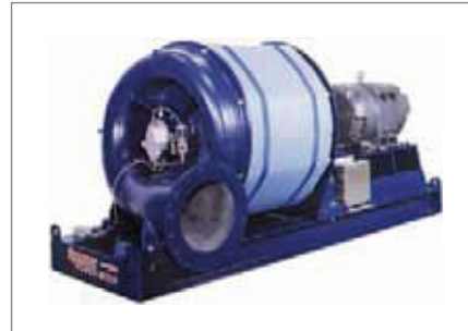
配备Acoustical Belly Wrap™（一种高效的降噪设备）的 Power Mizer 鼓风机。